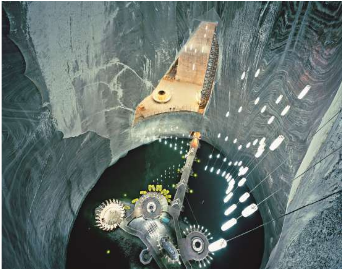
Salina Turda, Turda Potaissa Roumanie, 2013

Le sel est très important pour la santé de l'Homme, des animaux, pour la conservation des aliments ou pour la tannerie. Il fut la cause de nombreux conflits acharnés dans les temps anciens. Le plateau transylvanien comportait des dépôts de sel de mer remontant à la période du Miocène : les couches pouvaient faire jusqu'à 25 m d'épaisseur et, à certains endroits, atteignaient la surface. Le sel était extrait à Turda, près de l'implantation dacique de Potaissa, déjà à l'époque romaine: les arbres épaulés sont encore visibles de nos jours, ainsi que les rampes qui étaient utilisées pour amener le sel à la surface. Il existe des preuves de la présence d'une station de péage de la gabelle à Turda en 1075. L'extraction de sel s'est accrue en 1690 sous le règne des Habsbourg. Aujourd'hui, l'ancienne mine de sel avec son centre thérapeutique pour maladies respiratoires, doté d'installations sportives et d'un ascenseur panoramique en verre, constitue une attraction touristique majeure en Roumanie.