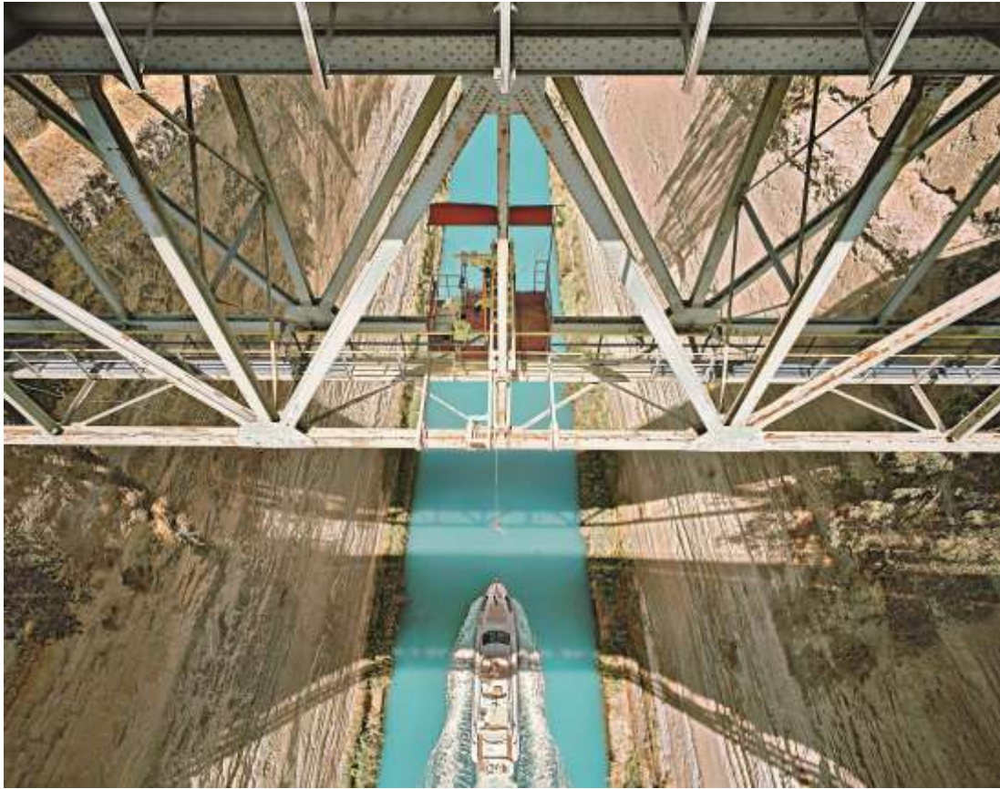
Canal de Corinthe, Isthmia Colonia Laus Iulia Corinthiensis Grèce, 2014

Le Péloponnèse est rattaché au continent par l'isthme de Corinthe, large de 6 kilomètres seulement dans sa partie la plus étroite. Afin d'éviter à ses navires le long trajet de 400 kilomètres jusqu'au cap Malée, onéreux et dangereux, l'empereur romain Néron décide de percer la langue de terre. Mais son décès en l'an 68 met un terme à cette ambitieuse entreprise. Ce n'est qu'en 1893, sous la responsabilité des ingénieurs hongrois Istvan Türr et Béla Gerstner, que sont lancés les travaux de la liaison maritime entre le golfe Saronique et le golfe de Corinthe. Les parois du canal de Corinthe s'élancent à une hauteur de près de 80 mètres avec un angle entre 71 et 77 °, la largeur du lit du canal est d'environ 24,6 mètres au niveau de la mer. Au vu de son importance économique, le canal de Corinthe, qui avait subi de nombreux dommages durant la seconde guerre mondiale, a été restauré et remis en service dès 1948. Bien que ses dimensions ne permettent le passage qu'aux navires de taille réduite, le canal est encore aujourd'hui utilisé par environ 11 000 ferrys et bateaux de plaisance. C'est aussi un lieu de saut à l'élastique. De l'un des cinq ponts, on peut sauter de plus de 40 mètres de haut entre les parois rocheuses abruptes, un frisson unique.