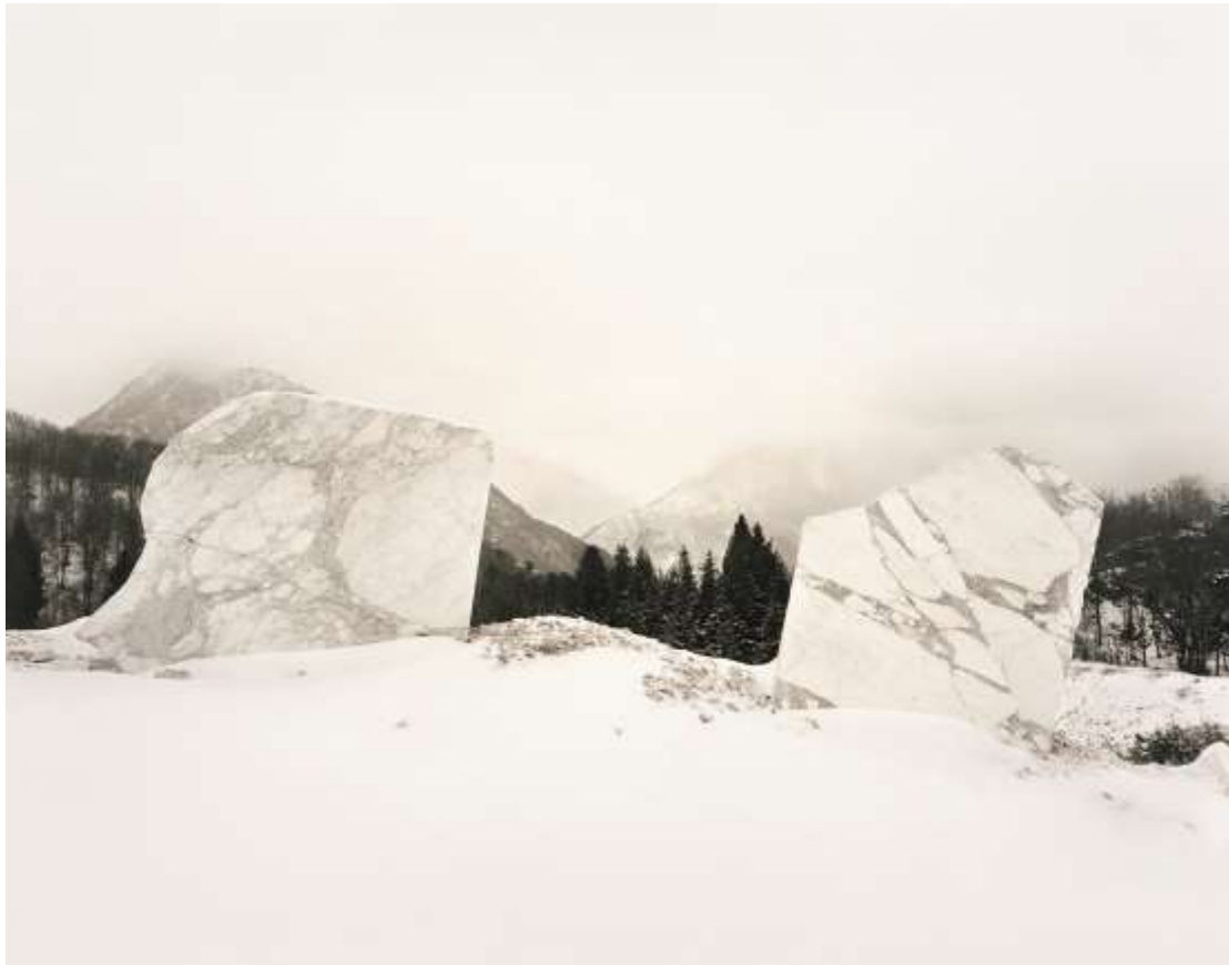
Carrière de Cervaiolo, Monte Altissimo Italie, 2010

L'extraction du marbre au mont Altissimo était une activité extrêmement laborieuse durant l'époque romaine, et le resta jusqu'à l'époque moderne. Les carrières se situent sur des versants abrupts à une altitude d'environ 1000 m. Des traces des anciennes méthodes d'extraction sont encore visibles à plusieurs endroits : des trous et des marques de scie sur les murs, des blocs grossièrement taillés mis de côté et des matériaux qui n'ont pas été enlevés. En règle générale, même les gigantesques blocs étaient enlevés manuellement par la méthode Lizzatura, c'est-à-dire qu'ils étaient descendus sur des traîneaux de bois ou avec l'aide de troncs d'arbres. Mais même après que le marbre ait pu être transporté par des ponts ou des tunnels par chemin de fer à vapeur, le transport de la pierre restait une entreprise dangereuse, comme il est possible de le constater dans le cimetière, près du village de Colonnata, où reposent les travailleurs qui moururent par accident dans les carrières.