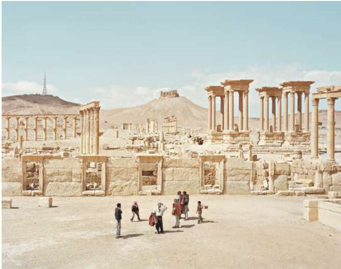
Palmyra, Tadmor Palmyra Syrie, 2011

La richesse de la ville oasis de Palmyre, Tadmor en ancien sémitique ou «cité des palmiers», était due à son emplacement sur la route caravanière entre Damas et l'Euphrate. Elle était ainsi prédestinée à devenir un centre de commerce pour les marchandises d'Arabie. L'empereur Caracalla promut cette cité au titre prestigieux de colonie et son importance est visible par des constructions monumentales telles que des temples, les colonnes le long d'une magnifique avenue, le tétrapylon du carrefour principal et l'agora à colonnades avec ses neuf entrées. En 261 après J.-C., l'empereur Gallien nomma le dirigeant de Palmyre, Odénat, son représentant dans la région. La veuve et successeur d'Odénat, Zénobie, aspirait à l'indépendance vis-à-vis de Rome. Cependant, elle fut défaite par l'empereur Aurélien et, peu après, Palmyre fut détruite. La ville sombra dans l'indifférence et, en 636 après J.-C., tomba aux mains des Arabes qui construisirent le fort de colline Qual'at Ibn Ma'n non loin de là.